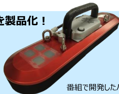
番組で開発したパッド

番組では100kgの人がぶら下がり、天井を雲梯のように進みました。 様々なワークに対応する 3サイズのラインナップで発売